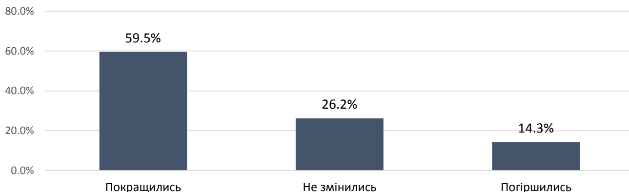
Рис. 1. Оцінка змін умов для ведення бізнесу у 2018 р. порівняно з 2016 р. підприємствами, що здійснюють ЗЕД, у 6-ти областях

Варто зазначити, що запитання про те, як, на їхню думку, змінилися умови ведення бізнесу протягом останніх двох років, було поставлено усім представникам зацікавлених сторін, з якими були проведені глибокі інтерв'ю в рамках адвокаційних кампаній. Для узагальнення результатів інтерв'ю за цим запитанням було взято відповіді лише представників підприємств, які здійснюють ЗЕД, оскільки більшість їх була у вибірці і їхня загальна кількість у всіх шести областях (96 підприємств) дає можливість провести відповідні обчислення та порівняння, що доповнюють висновки якісного дослідження.