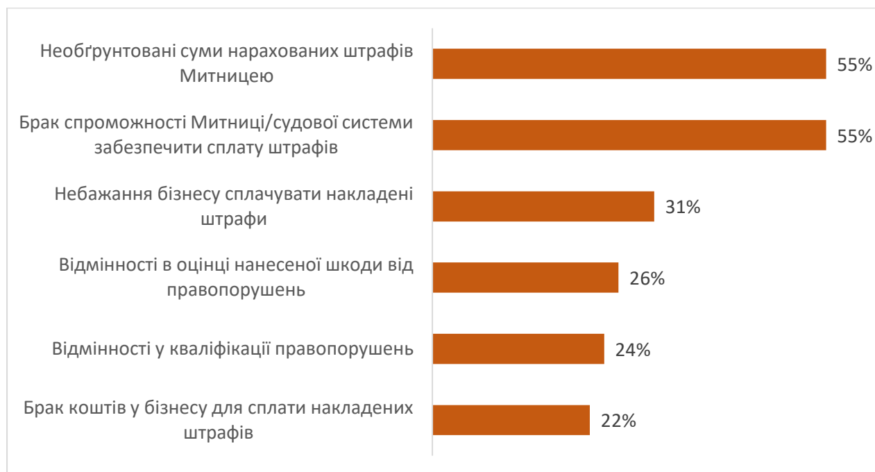
Рис. 3. Причини наявних відмінностей між розміром нарахованих та застосованих штрафів за порушення митних правил.