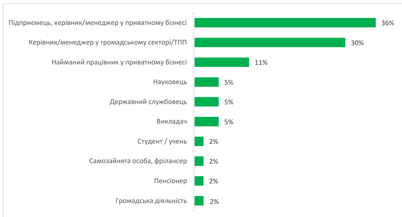
Рис. 1. Рід зайнятості опитаних респондентів

Майже однакову частку опитаних 36% і 30% відповідно, представляють приватний бізнес і громадський сектор, ще 11% опитаних є найнятими працівниками у приватному бізнесі.