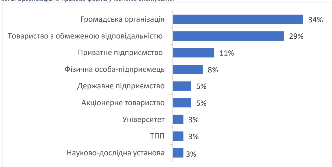
Рис. 1. Організаційно-правова форма учасників опитування