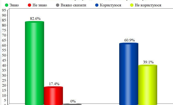
Особистий кабінет веб-порталу "Єдине вікно для міжнародної торгівлі"