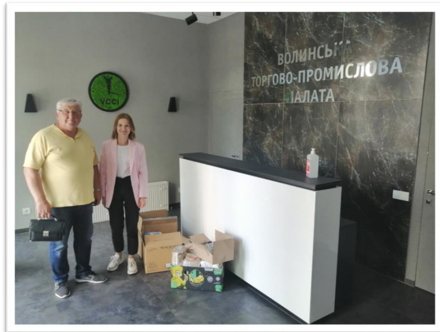
Передача гуманітарної допомоги для центру, який приймає ВПО на базі церкви «Дім Євангеліє» у м. Луцьк.