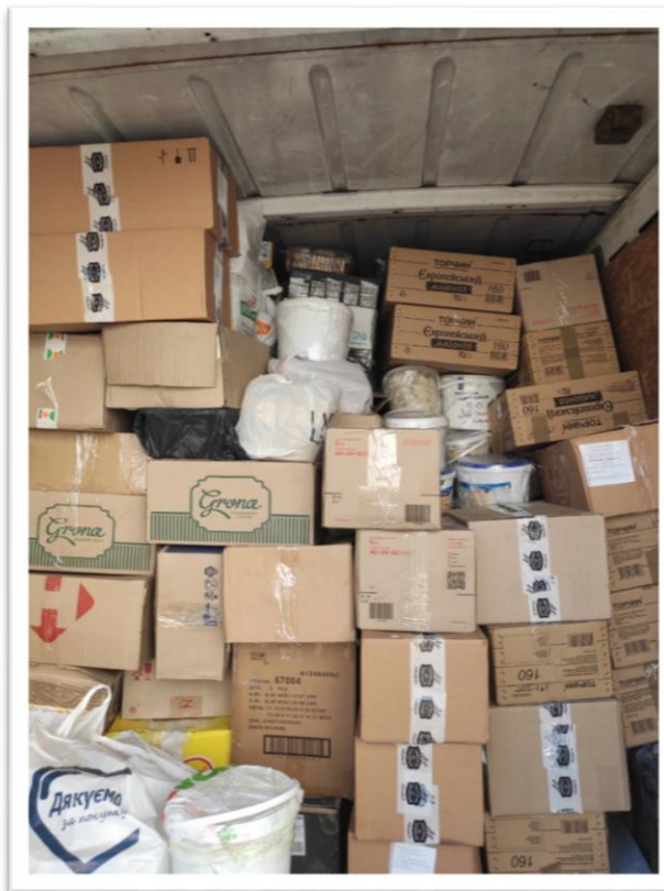
Обробка гуманітарних вантажів у одному з гуманітарних хабів.